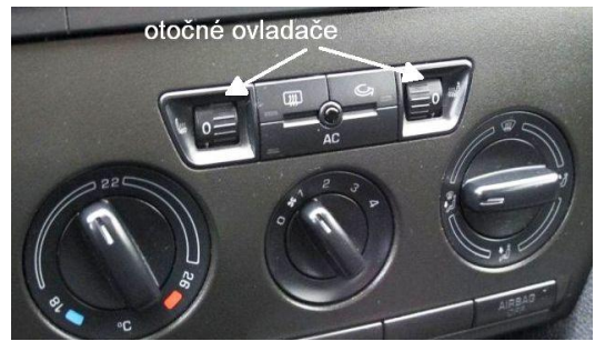
Obr. 2 Panel Climatic – manuální klimatizace před FL