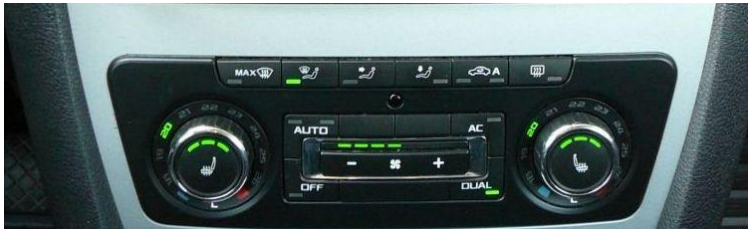
Obr.3 panel Climatronic po faceliftu