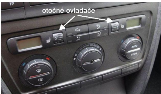
Obr.1 Panel Climatronic - aut. klimatizace před FL